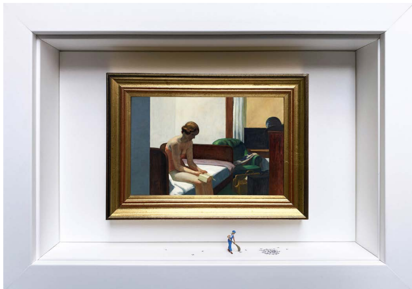
Dead Leaves Édition limitée à 12 exemplaires - limited edition of 12 34 x 24 x 6,5 cm - 13 x 9 x 2,5 inches Clin d'oeil à l'oeuvre Chambre d'hôtel d'Edward Hopper (1931) A nod to the artwork Hotel Room by Edward Hopper (1931)