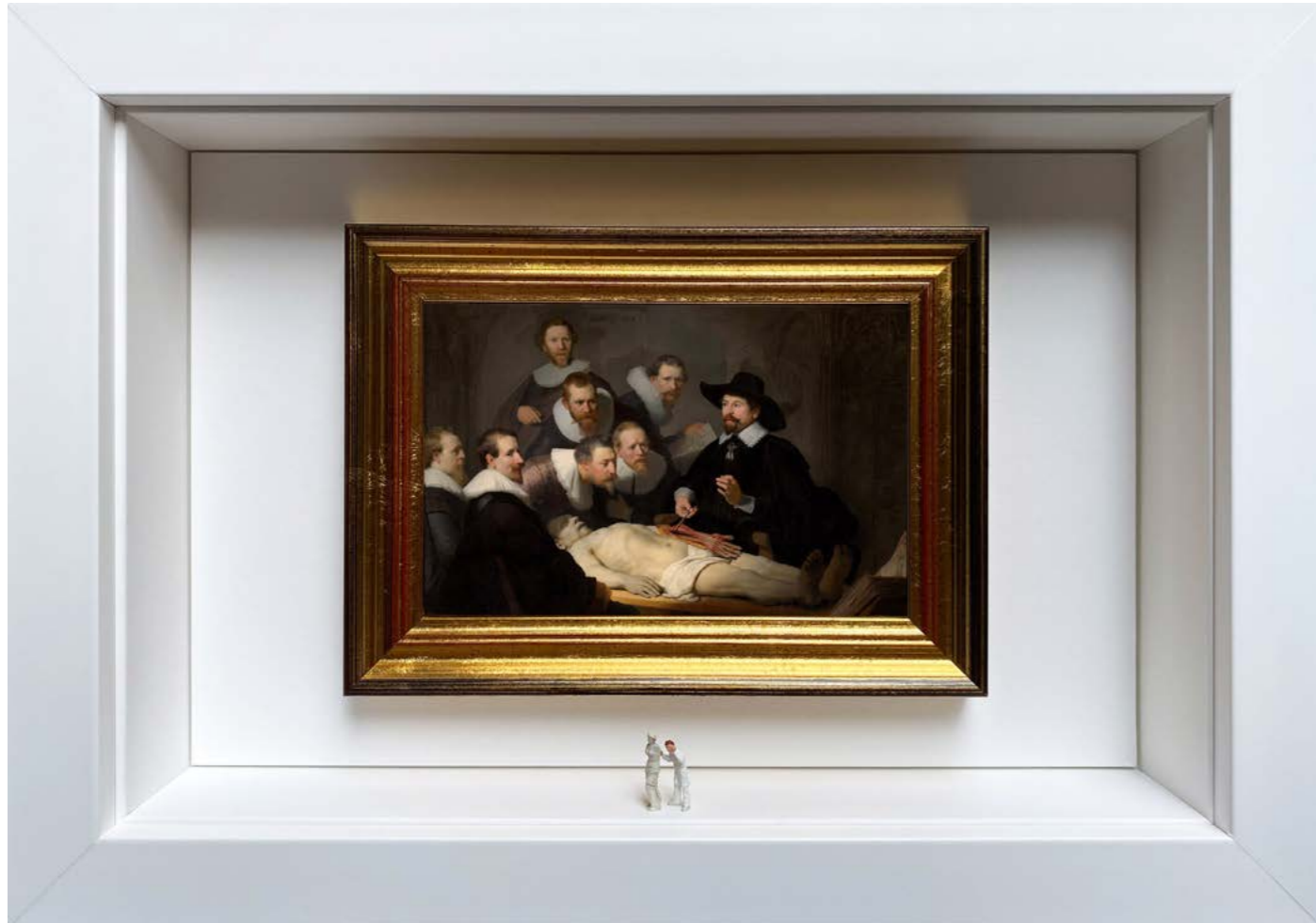
Gray's Anatomy Édition limitée à 12 exemplaires - limited edition of 12 34 x 24 x 6,5 cm - 13 x 9 x 2,5 inches Clin d'oeil à l'oeuvre La Leçon d'anatomie du docteur Tulp de Rembrandt (1632) A nod to the artwork The Anatomy Lesson of Dr. Nicolaes Tulp by Rembrandt (1632)