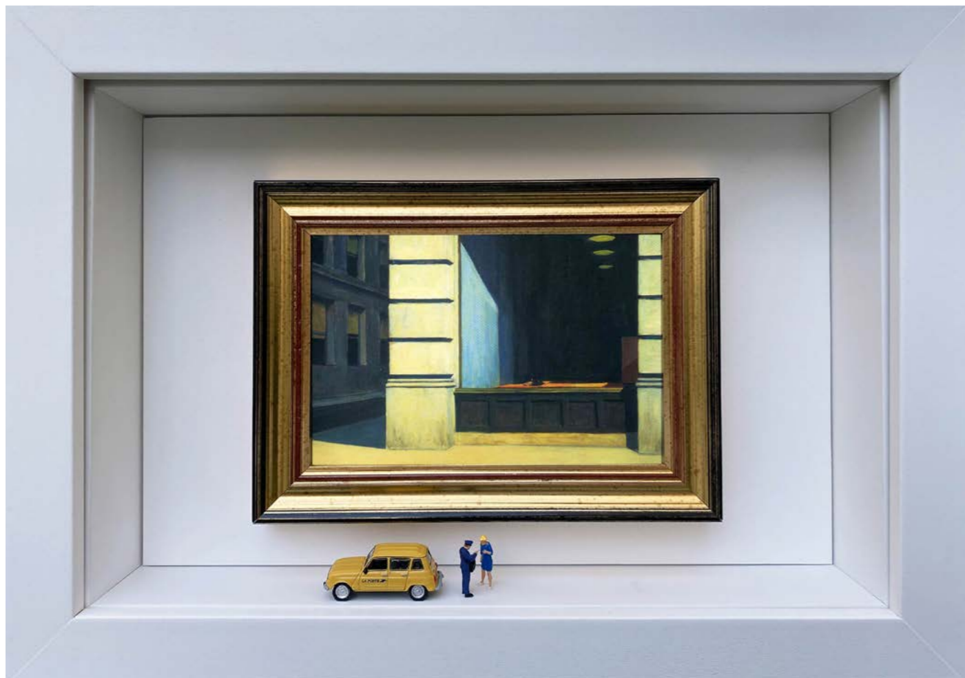
At last! Édition limitée à 12 exemplaires - limited edition of 12 34 x 24 x 6,5 cm - 13 x 9 x 2,5 inches Clin d'oeil à l'oeuvre Bureau à New York d'Edward Hopper (1962) A nod to the artwork New York Office by Edward Hopper (1962)