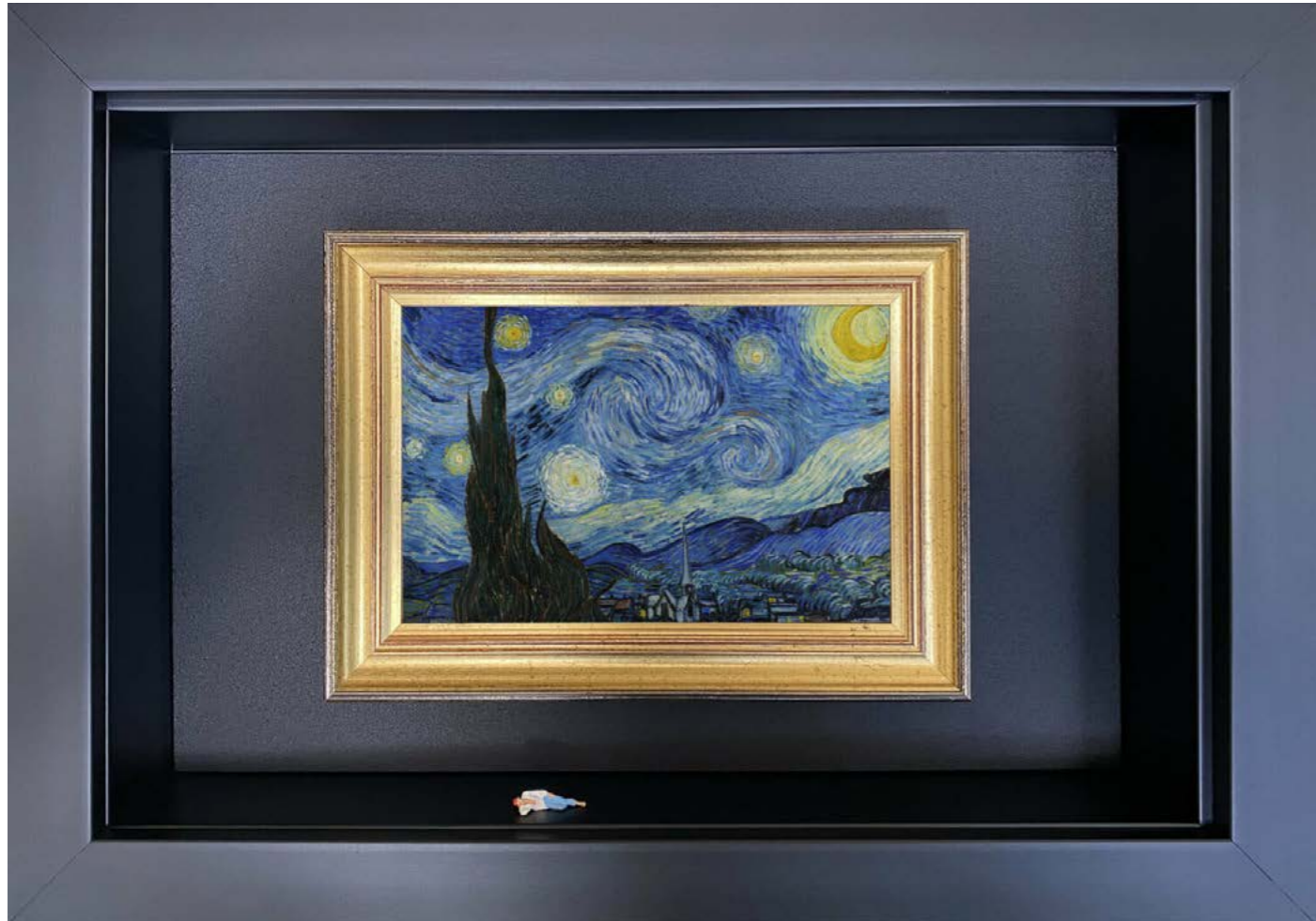
The Dream Édition limitée à 12 exemplaires - limited edition of 12 34 x 24 x 6,5 cm - 13 x 9 x 2,5 inches Clin d'oeil à l'oeuvre La Nuit étoilée (à Saint-Rémy-de-Provence) de Vincent Van Gogh (1889) A nod to the artwork The Starry Night (in Saint-Rémy-de-Provence) by Vincent Van Gogh (1889)