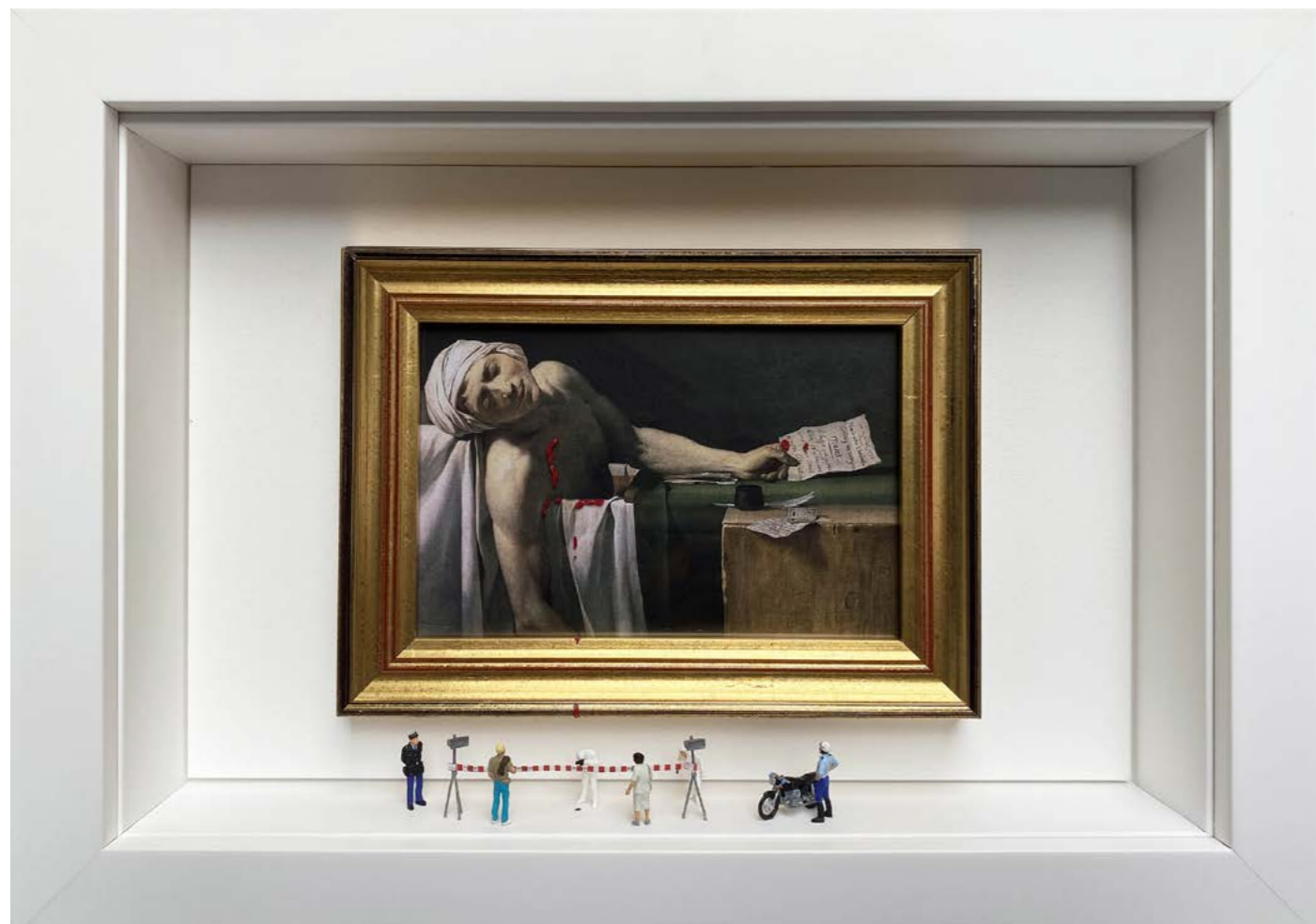
Do Not Cross (Some characters may slightly vary) Édition limitée à 12 exemplaires - Limited edition of 12 34 x 24 x 6,5 cm - 13 x 9 x 2,5 inches Clin d'oeil à l'oeuvre La Mort de Marat de Jacques-Louis David (1793) A nod to the artwork The Death of Marat by Jacques-Louis David (1793)