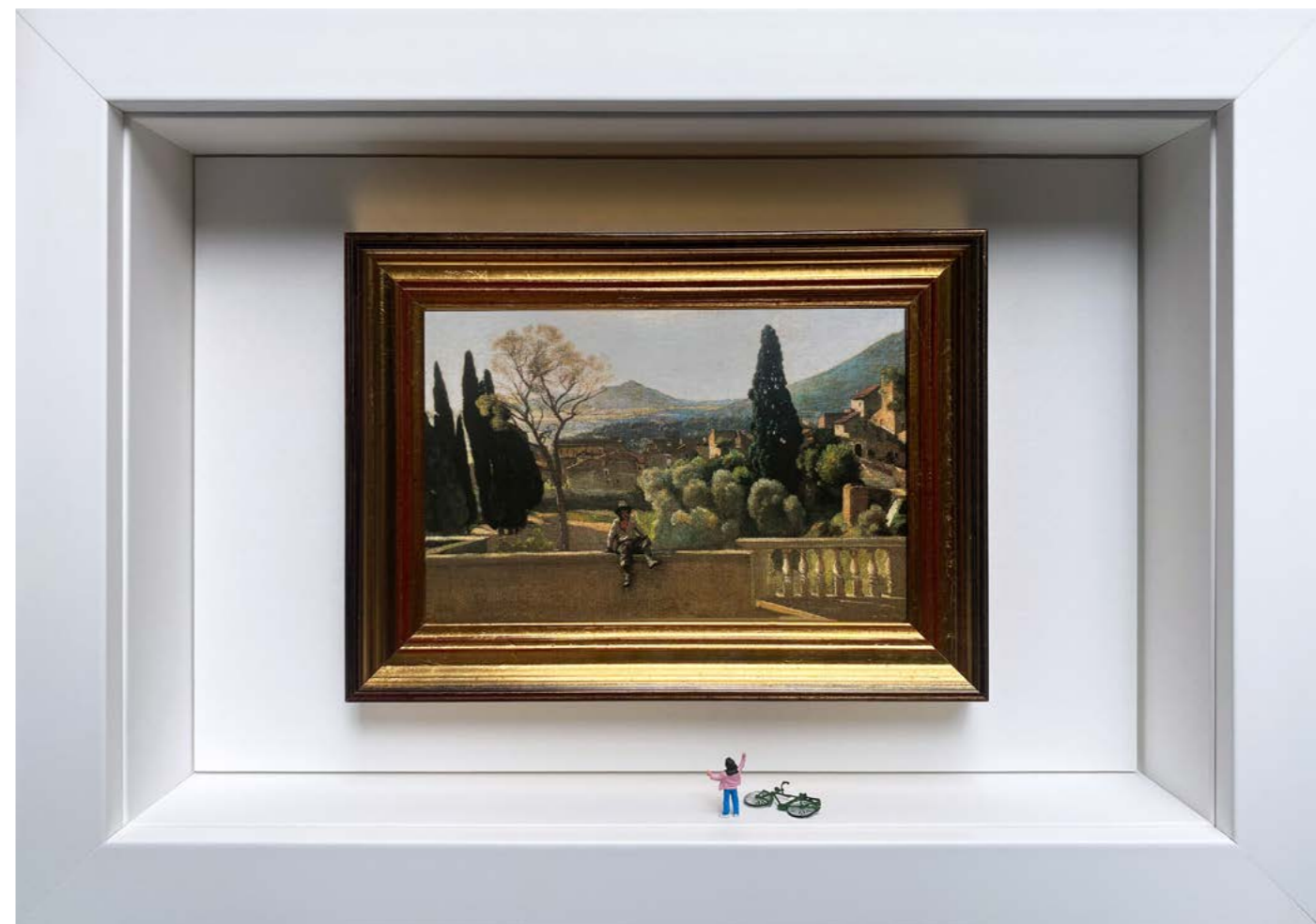
Retrouvailles Édition limitée à 12 exemplaires - Limited edition of 12 34 x 24 x 6,5 cm - 13 x 9 x 2,5 inches Clin d'oeil à l'oeuvre Tivoli, les jardins de la Villa d'Este de Jean-Baptiste Camille Corot (1843) A nod to the artwork Tivoli, Gardens of the Villa d'Este by Jean-Baptiste Camille Corot (1843)