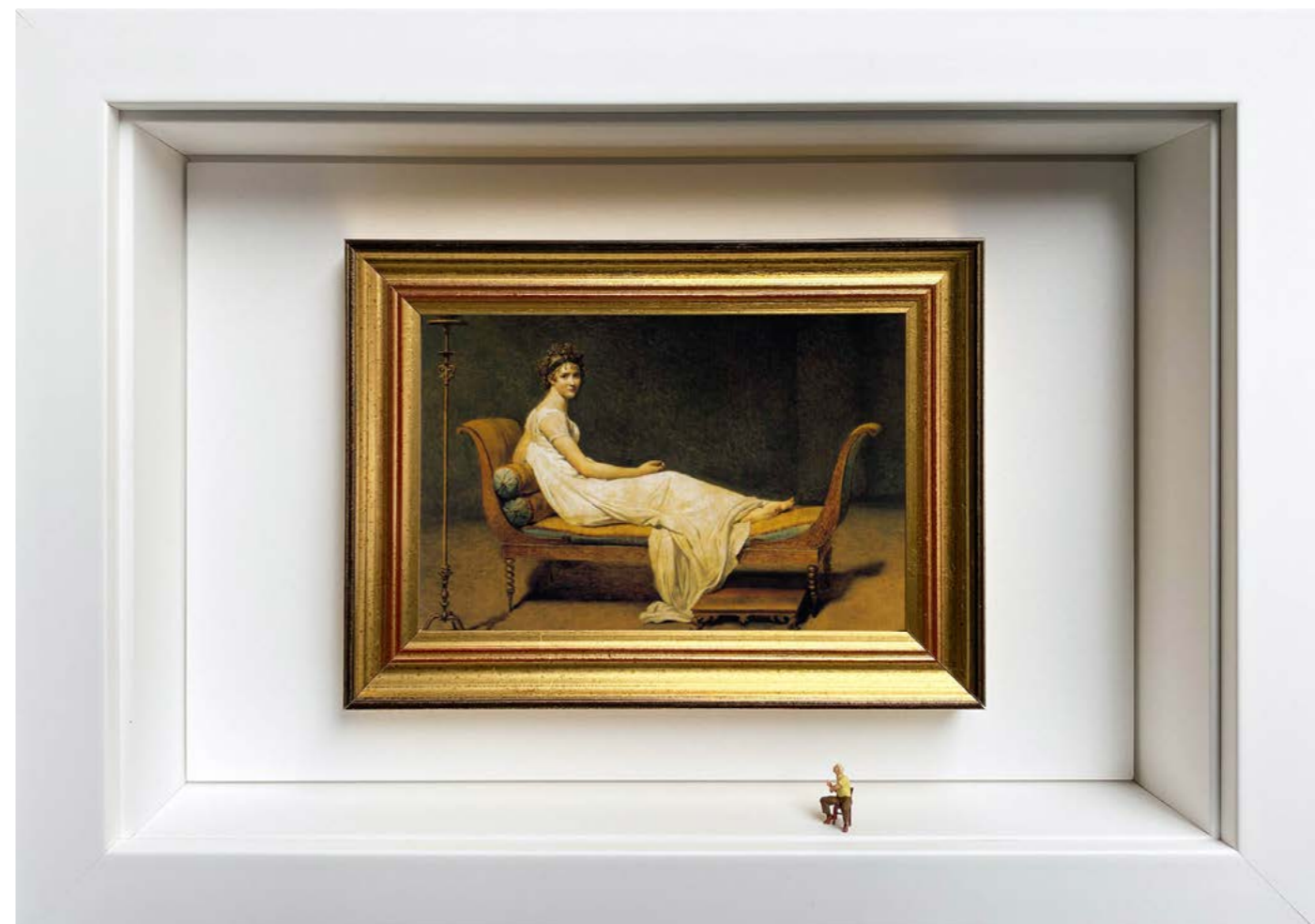
Therapy Session Édition limitée à 12 exemplaires - Limited edition of 12 34 x 24 x 6,5 cm - 13 x 9 x 2,5 inches Clin d'oeil à l'oeuvre Portrait of Madame Récamier de Jacques-Louis David (1800) A nod to the artwork Portrait of Madame Récamier by Jacques-Louis David (1800)