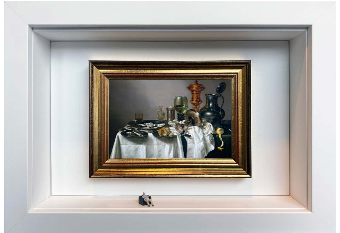
Natures Mortes Édition limitée à 12 exemplaires - limited edition of 12 34 x 24 x 6,5 cm - 13 x 9 x 2,5 inches Clin d'oeil à l'oeuvre Nature morte au gobelet doré de Willem Claesz Heda (1635) A nod to the artwork Still Life with Gilt Goblet by Willem Claesz Heda (1635)