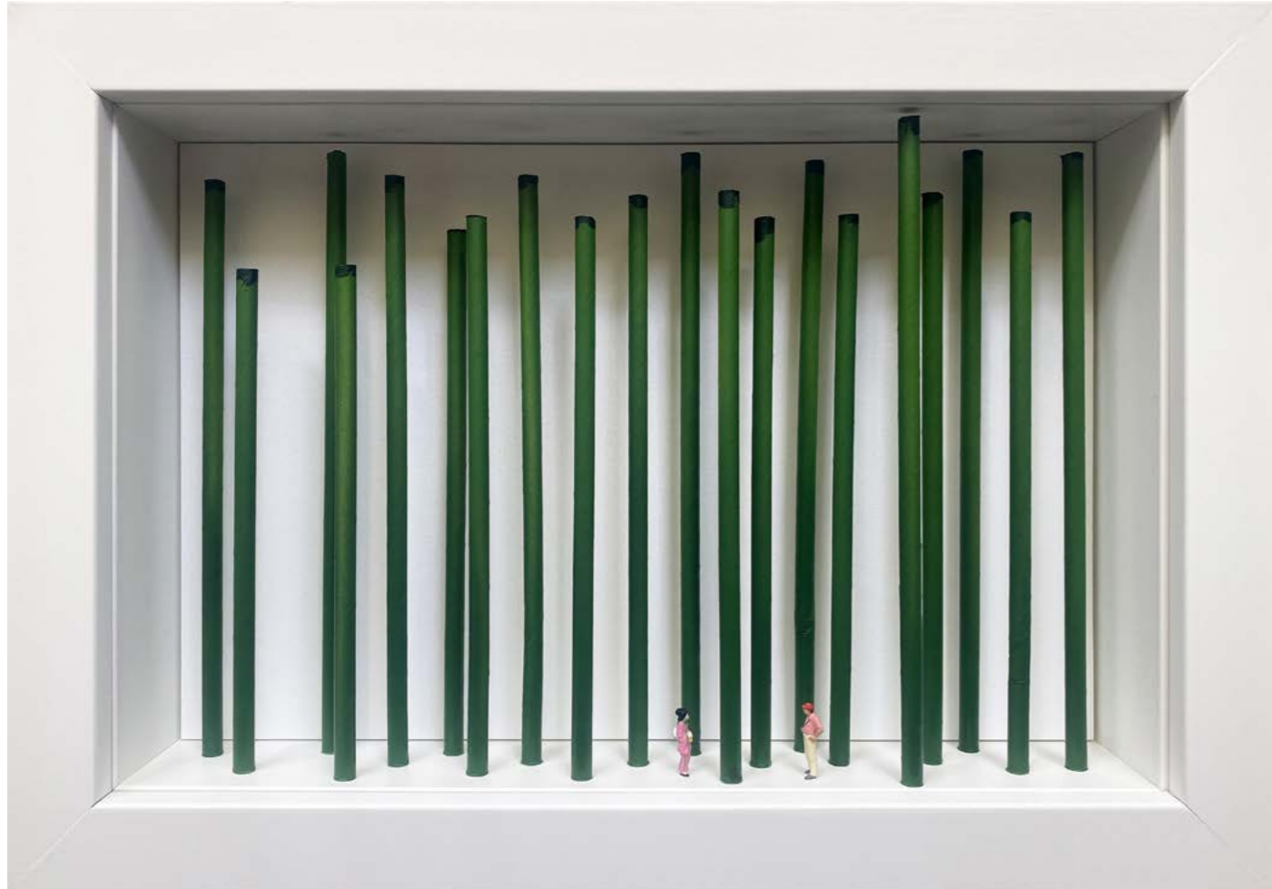
It's a match! Édition limitée à 12 exemplaires - Limited edition of 12 34 x 24 x 6,5 cm - 13 x 9 x 2,5 inches Clin d'oeil à Martin Parr A nod to Martin Parr