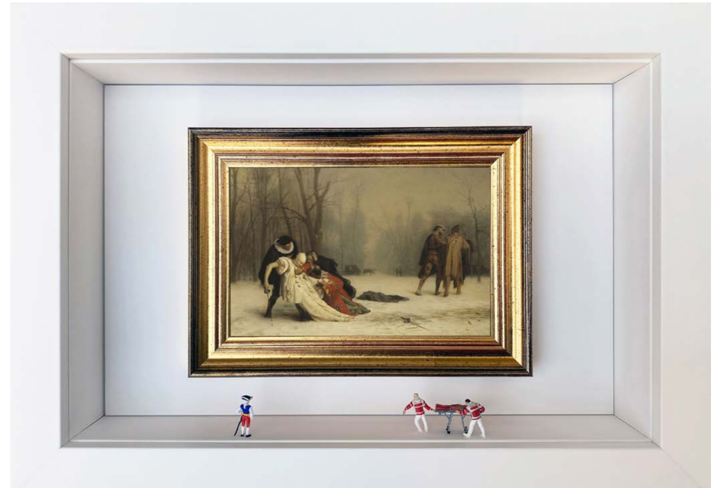
Afterparty Édition limitée à 12 exemplaires - Limited edition of 12 34 x 24 x 6,5 cm - 13 x 9 x 2,5 inches Clin d'oeil à l'oeuvre Suites d'un bal masqué de Jean-Léon Gérôme (1857) A nod to the artwork The Duel After the Masquerade by Jean-Léon Gérôme (1857)