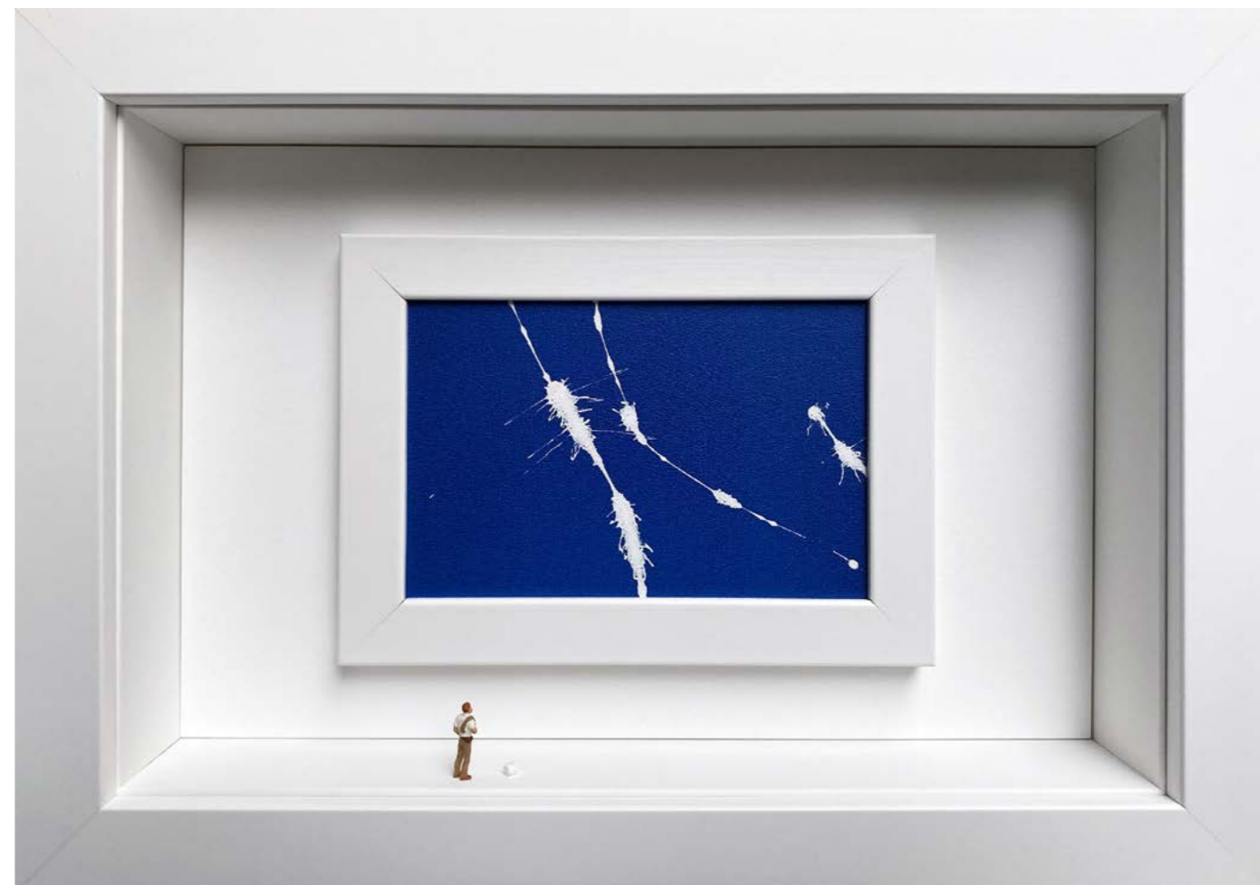
Pimp My Klein (White paint splash will vary in each edition) Édition limitée à 12 exemplaires - limited edition of 12 34 x 24 x 6,5 cm - 13 x 9 x 2,5 inches Clin d'oeil à l'Action Painting de Jackson Pollock (1912 - 1956) et l'International Klein Blue d'Yves Klein (1928 - 1962) A nod to Jackson Pollock's (1912 - 1956) Action Painting and Yves Klein's (1928 - 1962) International Klein Blue