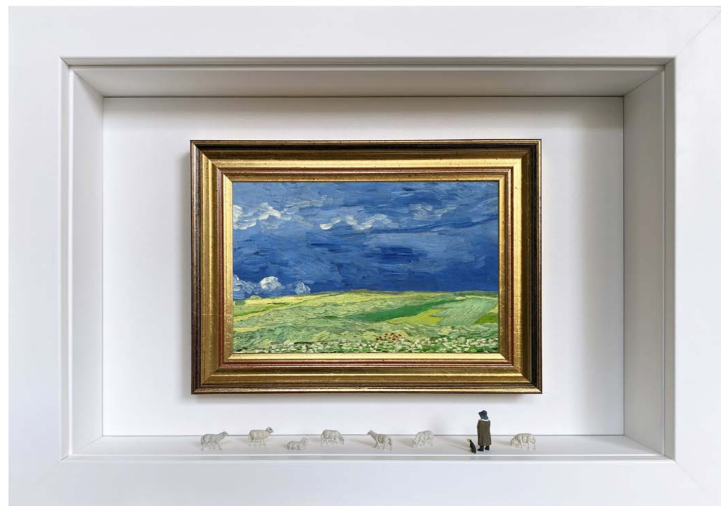
Day Tripper Édition limitée à 12 exemplaires - Limited edition of 12 34 x 24 x 6,5 cm - 13 x 9 x 2,5 inches Clin d'oeil à l'oeuvre Champ de blé sous des nuages d'orage de Vincent van Gogh (1890) A nod to the artwork Wheatfield Under Thunderclouds by Vincent van Gogh (1890)