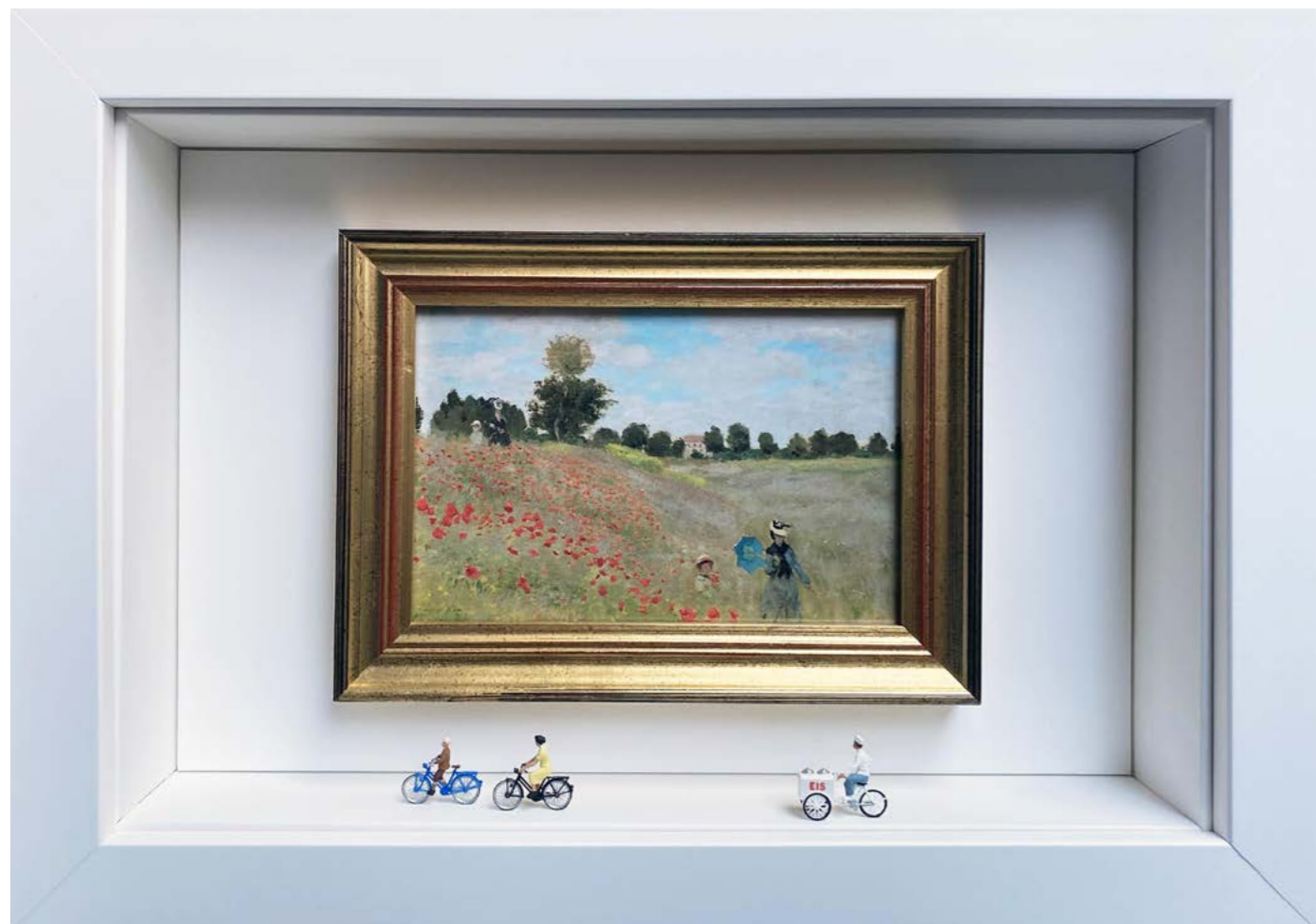
The Great Escape Édition limitée à 12 exemplaires - limited edition of 12 34 x 24 x 6,5 cm - 13 x 9 x 2,5 inches Clin d'oeil à l'oeuvre Les Coquelicots de Claude Monet (1873) A nod to the artwork The Poppy Field by Claude Monet (1873)