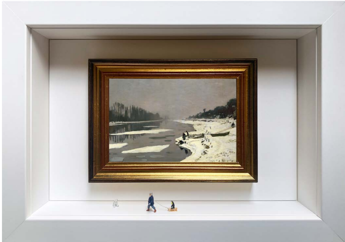
When We Ride

Édition limitée à 12 exemplaires - limited edition of 12