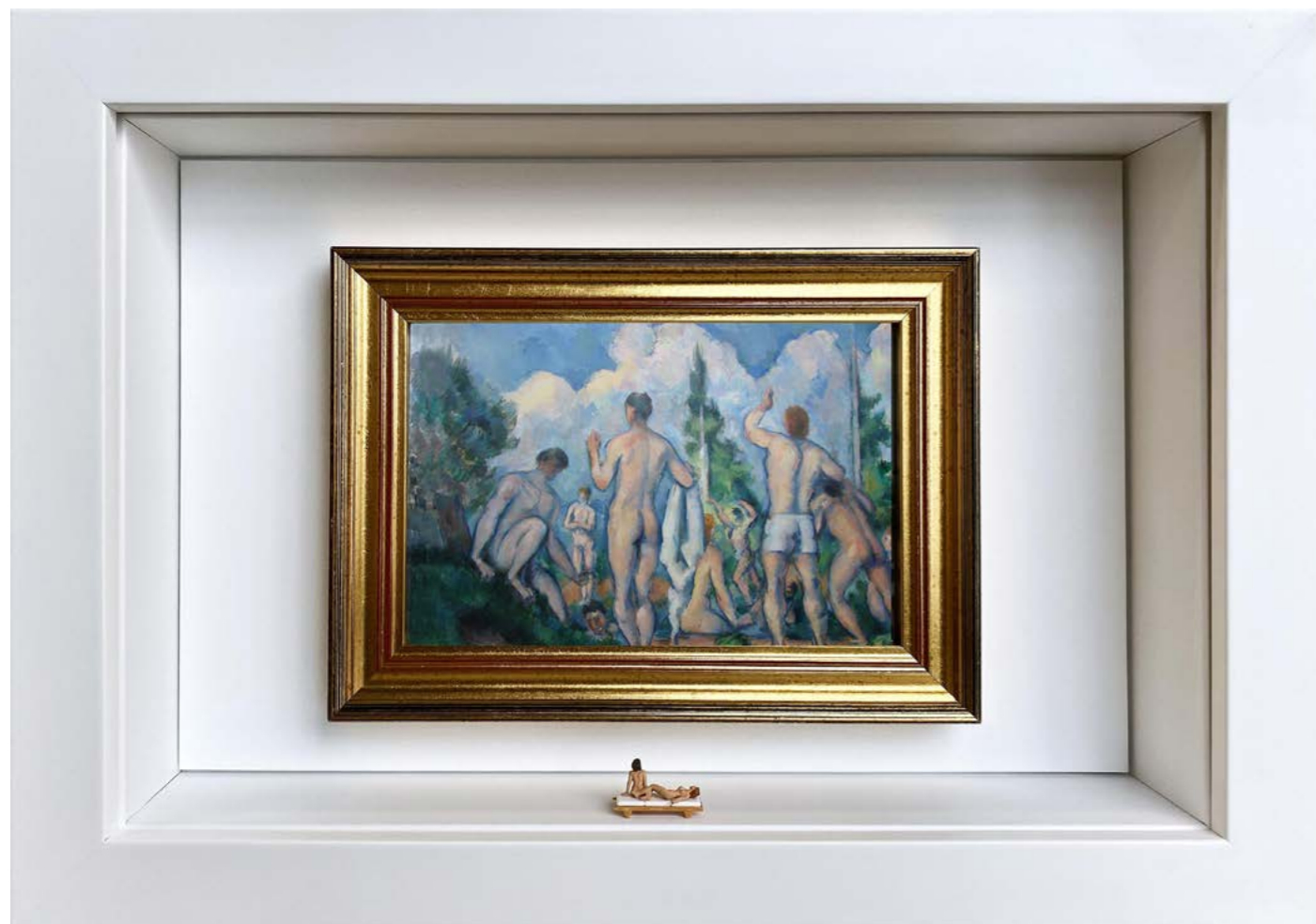
Peep Show Édition limitée à 12 exemplaires - Limited edition of 12 34 x 24 x 6,5 cm - 13 x 9 x 2,5 inches Clin d'oeil à l'oeuvre Les Baigneurs de Paul Cézanne (1890) A nod to the artwork Bathers by Paul Cézanne (1890)