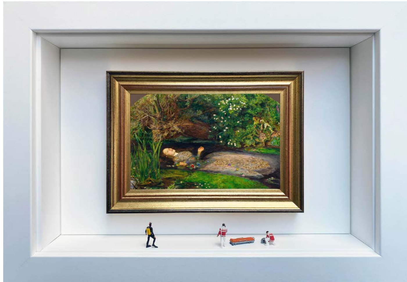
Mystic River Édition limitée à 12 exemplaires - Limited edition of 12 34 x 24 x 6,5 cm - 13 x 9 x 2,5 inches Clin d'oeil à l'oeuvre Ophélie de John Everett Millais (1851-1852) A nod to the artwork Ophelia by John Everett Millais (1851-1852)