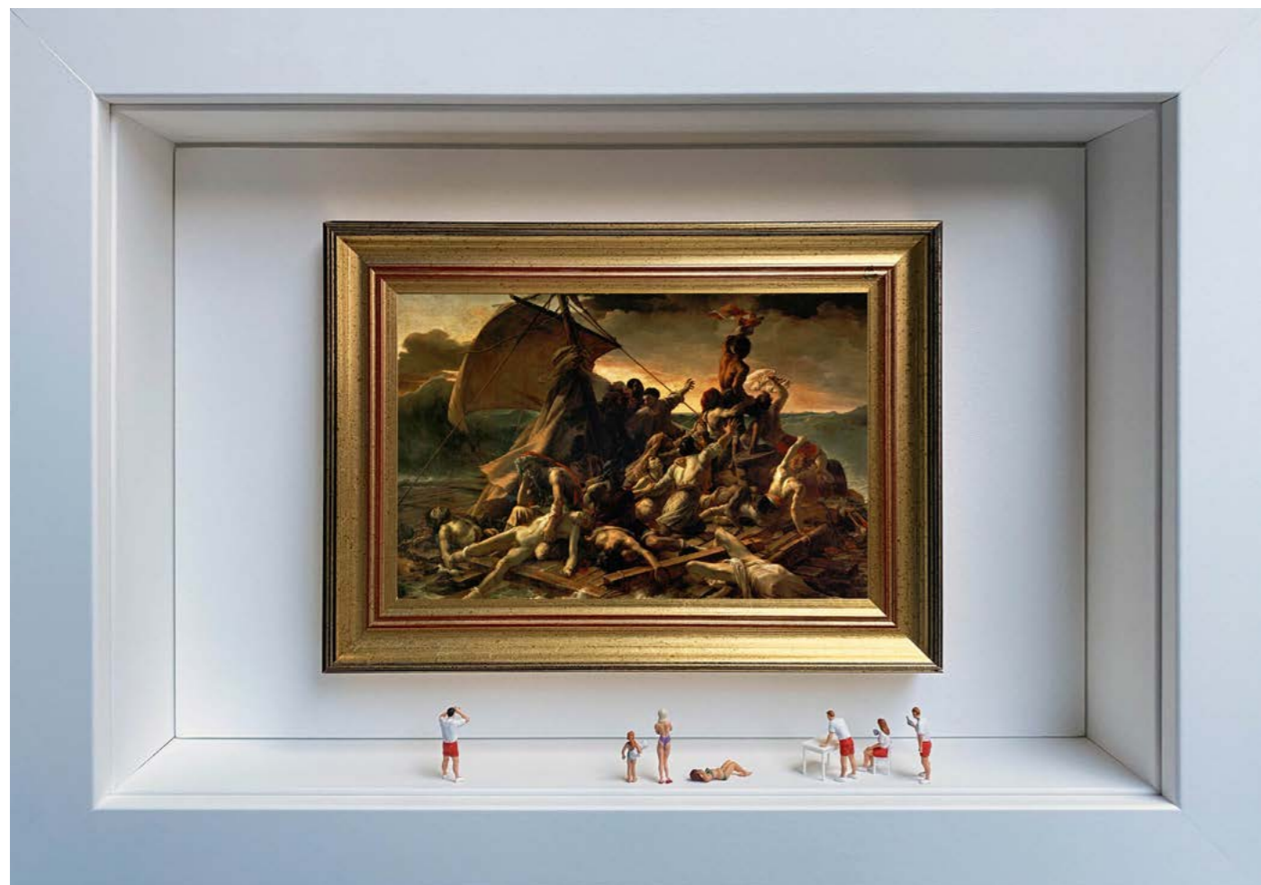
Baywatch (Some characters may slightly vary) Édition limitée à 12 exemplaires - Limited edition of 12 34 x 24 x 6,5 cm - 13 x 9 x 2,5 inches Clin d'oeil à l'oeuvre Le Radeau de La Méduse de Théodore Géricault (1818 - 1819) A nod to the artwork The Raft of the Medusa by Théodore Géricault (1818 - 1819)