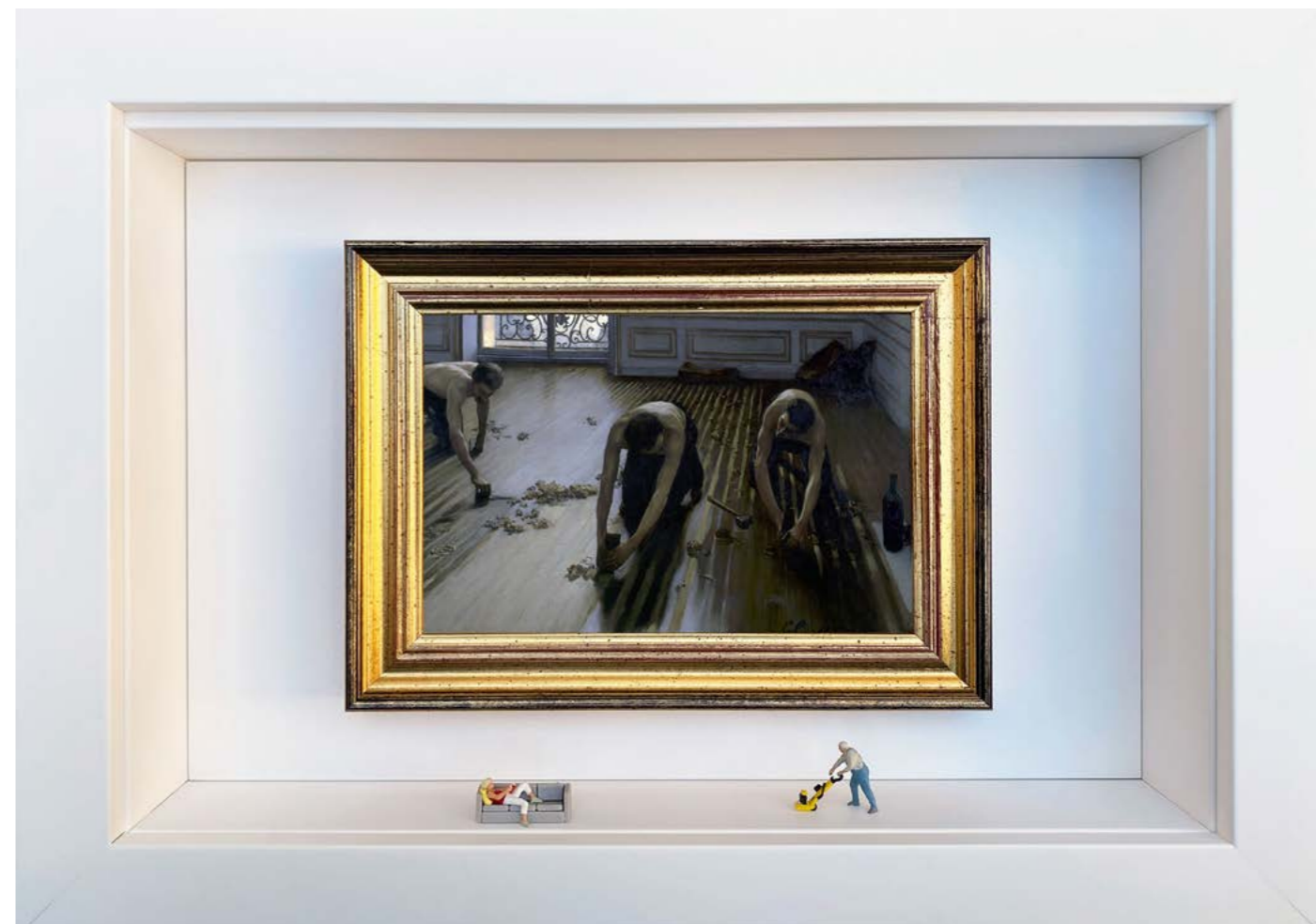
Spatio-temporel Édition limitée à 12 exemplaires - limited edition of 12 34 x 24 x 6,5 cm - 13 x 9 x 2,5 inches Clin d'oeil à l'oeuvre Raboteurs de parquet de Gustave Caillebotte (1875) A nod to the artwork The Floor Scrapers by Gustave Caillebotte (1875)