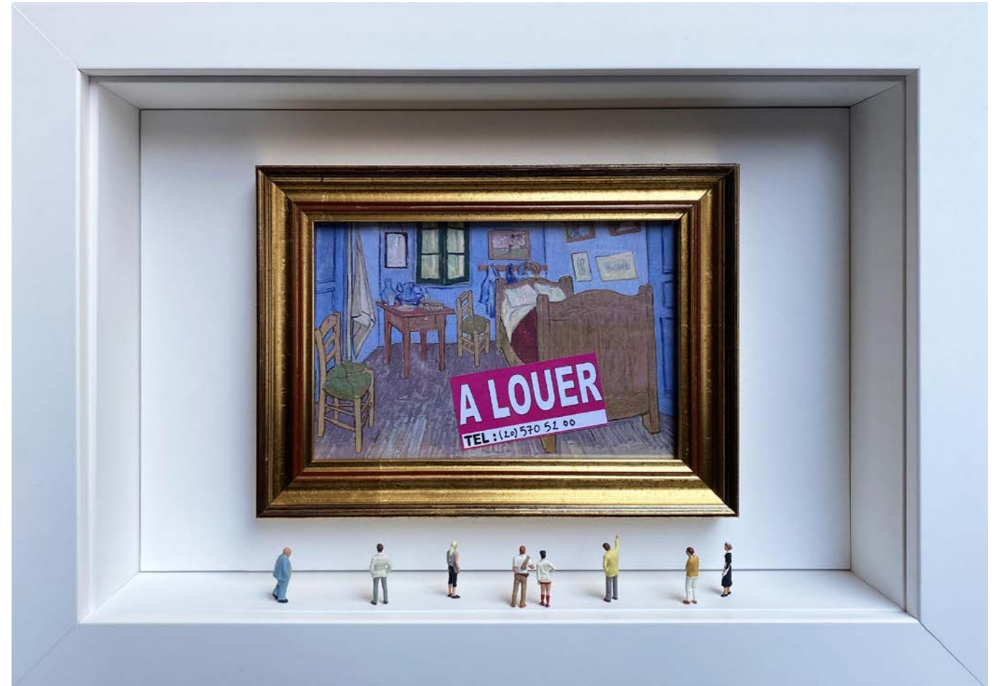
Room For Rent (Some characters may slightly vary) Édition limitée à 12 exemplaires - limited edition of 12 34 x 24 x 6,5 cm - 13 x 9 x 2,5 inches Clin d'oeil à l'oeuvre La Chambre de Van Gogh à Arles de Vincent van Gogh (1889) A nod to the artwork Bedroom in Arles by Vincent van Gogh (1889)