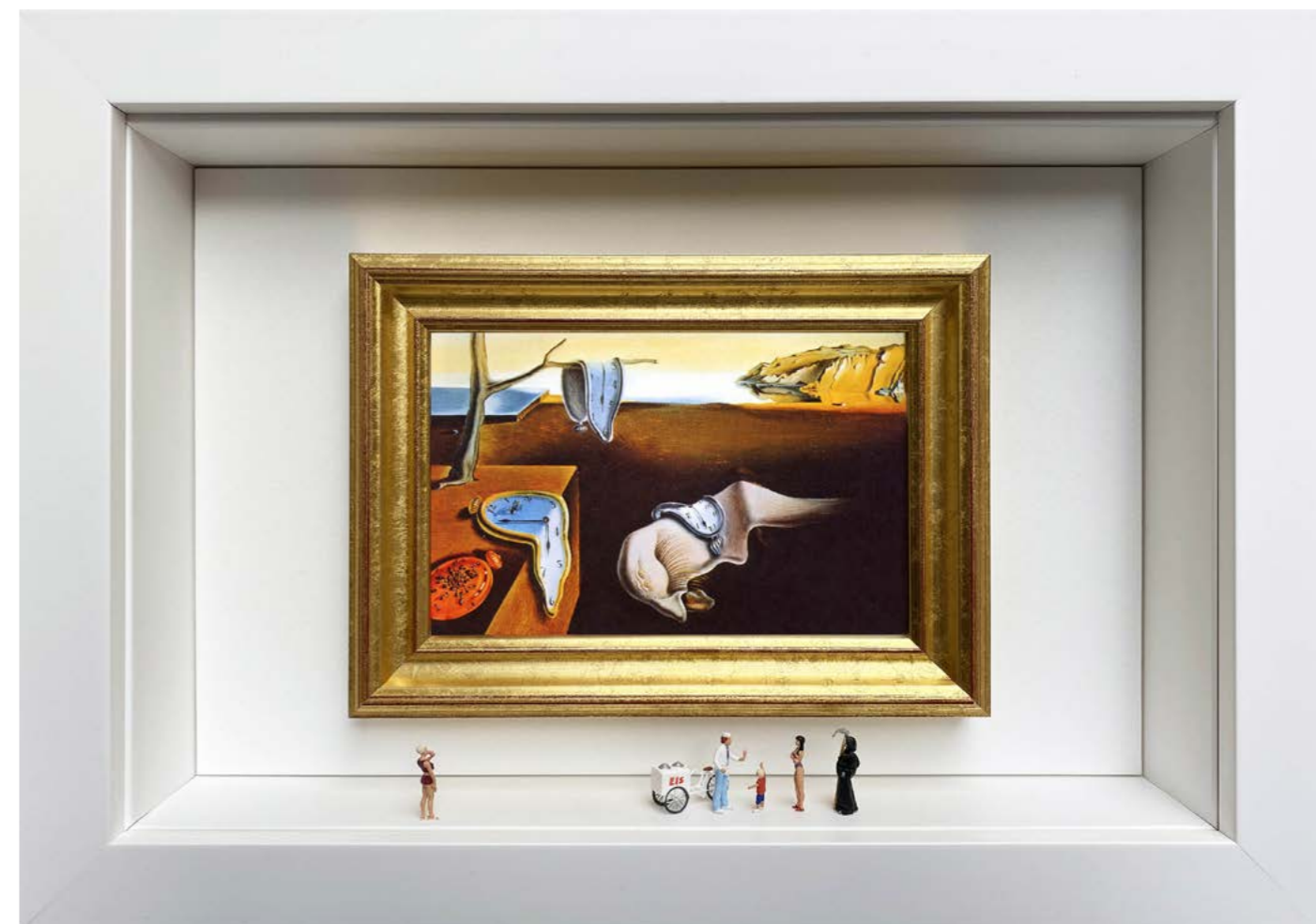
A Well-Deserved Break (Some characters may slightly vary) Édition limitée à 12 exemplaires - limited edition of 12 34 x 24 x 6,5 cm - 13 x 9 x 2,5 inches Clin d'oeil à l'oeuvre La Persistance de la mémoire de Salvador Dalí (1931) A nod to the artwork The Persistence of Memory by Salvador Dalí (1931)